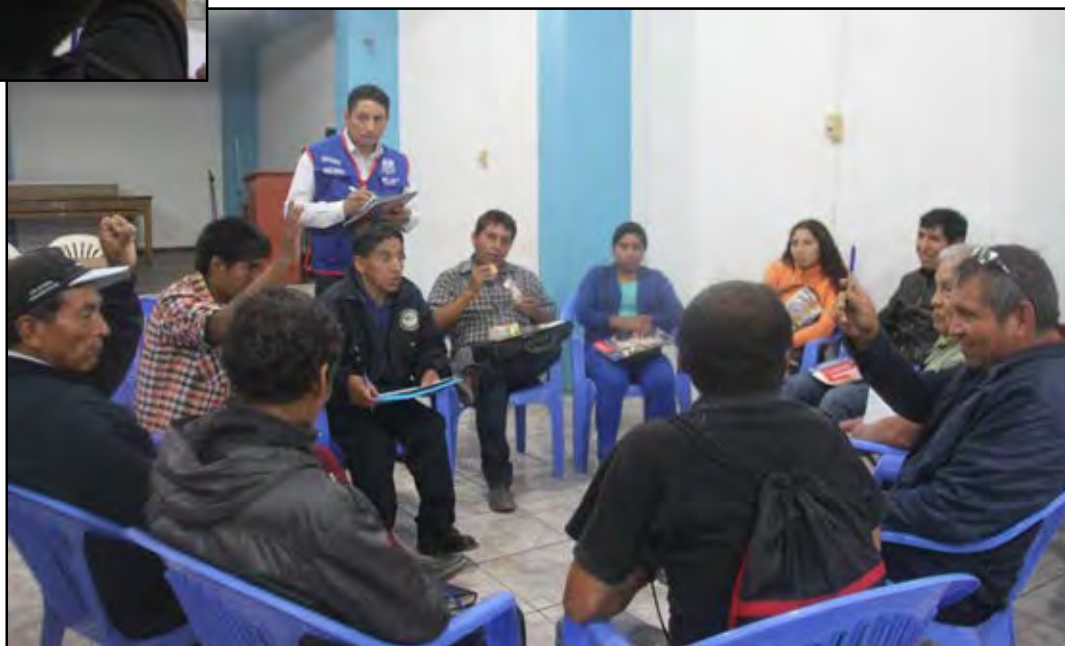
Elección del Comité de Vigilancia Ciudadana y Control