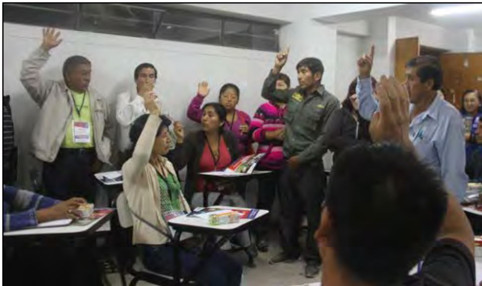
Talleres Descentralizados de Presentación de Proyectos