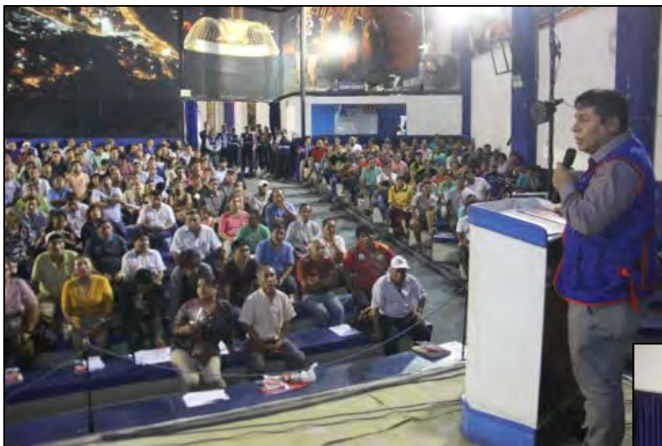
Taller Distrital de Capacitación